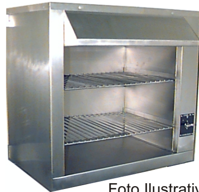
Foto Ilustrativa Salamandra 2 Câmaras

Aquecimento elétrico através de conjuntos de resistências 3 Kw para 1 câmara e 6 Kw para 2 câmaras, 220V monofásico, 60Hz controlados por termostato.