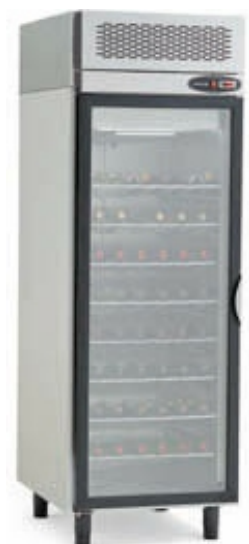
EPRV-700 EPAV-700 EPNV-700 c/ porta em vidro