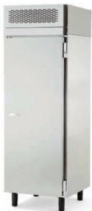
EPRV-700 EPAV-700 EPNV-700