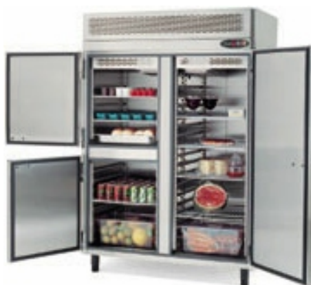
EPRV-1400 EPAV-1400 EPNV-1400