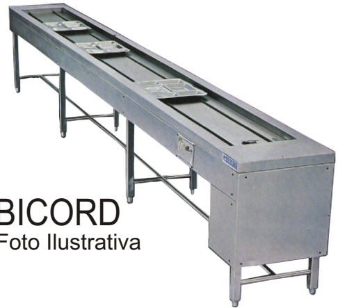
BICORD Foto Ilustrativa