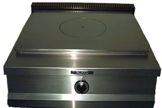
EFPG7-72 TOP Foto Ilustrativa