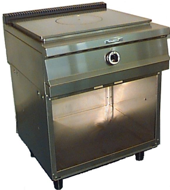
EFPG7-72 c/ Armário inferior Foto Ilustrativa

Fabricação total em aço inoxidável AISI-304, liga 18.8. Queimadores em ferro fundido tratado e acendimento manual com chama piloto. Válvula de segurança contra falta de chama. Gaveta p/. Recolhimento. Consumo 0,45 Kg/h GLP. Pressão de gás: GLP 28 mbar (0,280 Kg/cm 2 ) Natural 15/20 mbar (0,150/0,200 Kg/cm 2 ) Dimensões: 720x730x900mm