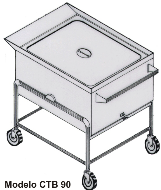
Modelo CTB 90