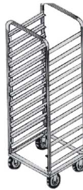
CGS 12.1/ 16.1 ou CGS 12.2/ 16.2