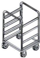
CGS 5.1/ 7.1 ou CGS 5.2/ 7.2

Soldas: Em atmosfera de argônio invisíveis e polimento fosco.