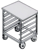
CGST 5.1/ 7.1 ou CGST 5.2/ 7.2