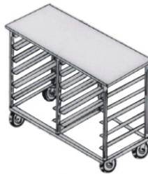
CGDT 10.1 ou CGDT 14.1